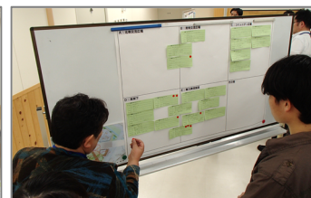
皆さんのアイデアを眺めて、いいね！シールを貼っていきました